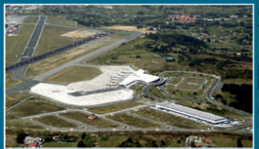
LOIUKO AIREPORTUA / AEROPUERTO DE LOIU