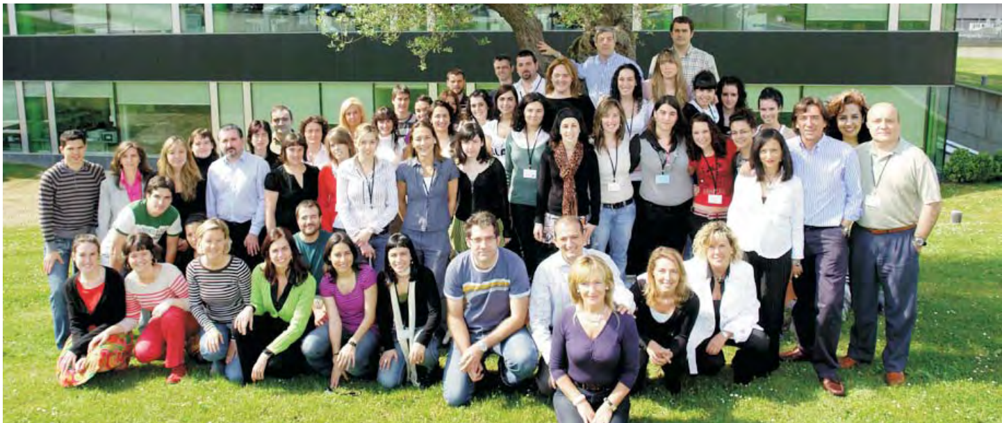
Urtebete Teknologia Parkearen bizitzan

• BOKABI Bioinkubadoreak, Bizkaiko Teknologia Parkeak eta BEAZ, S.A.-k sustatutakoa, bere jardueraren bigarren urtean guztira 8 enpresen sorrera eta garapena babestu du.